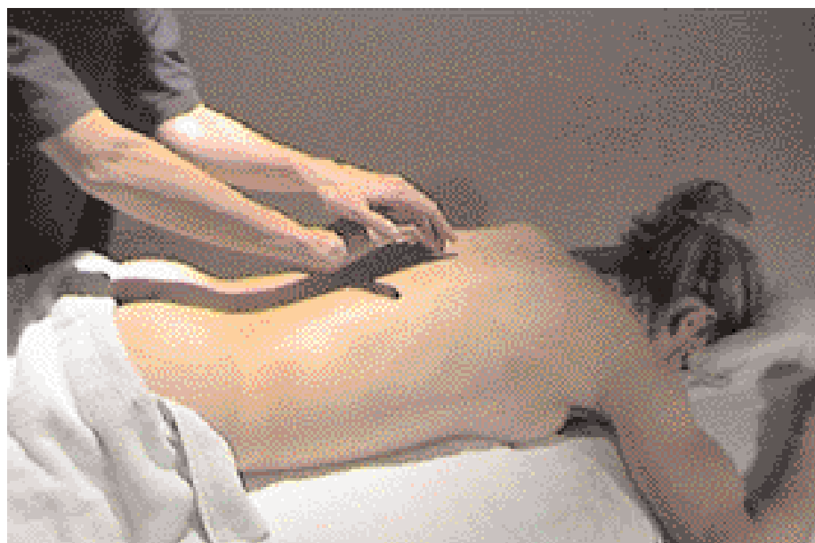
◆ Fig. 2 - Il Flower-Massage®

Definito l'olio eluente più adatto, la nostra ricerca si è indirizzata a mettere a punto una specifica manualità di massaggio, oltre ovviamente a individuare un'ottima combinazione di Fiori, da massaggiare con risultati significativi nel più ampio numero di casi. Il cocktail di Rimedi, statisticamente rivelatosi più efficace, sul più largo spettro di sperimentatori, è risultato essere costituito da: Impatiens, Olive, Elm, Star of Bethlehem, Holly, Willow e Rock Water.